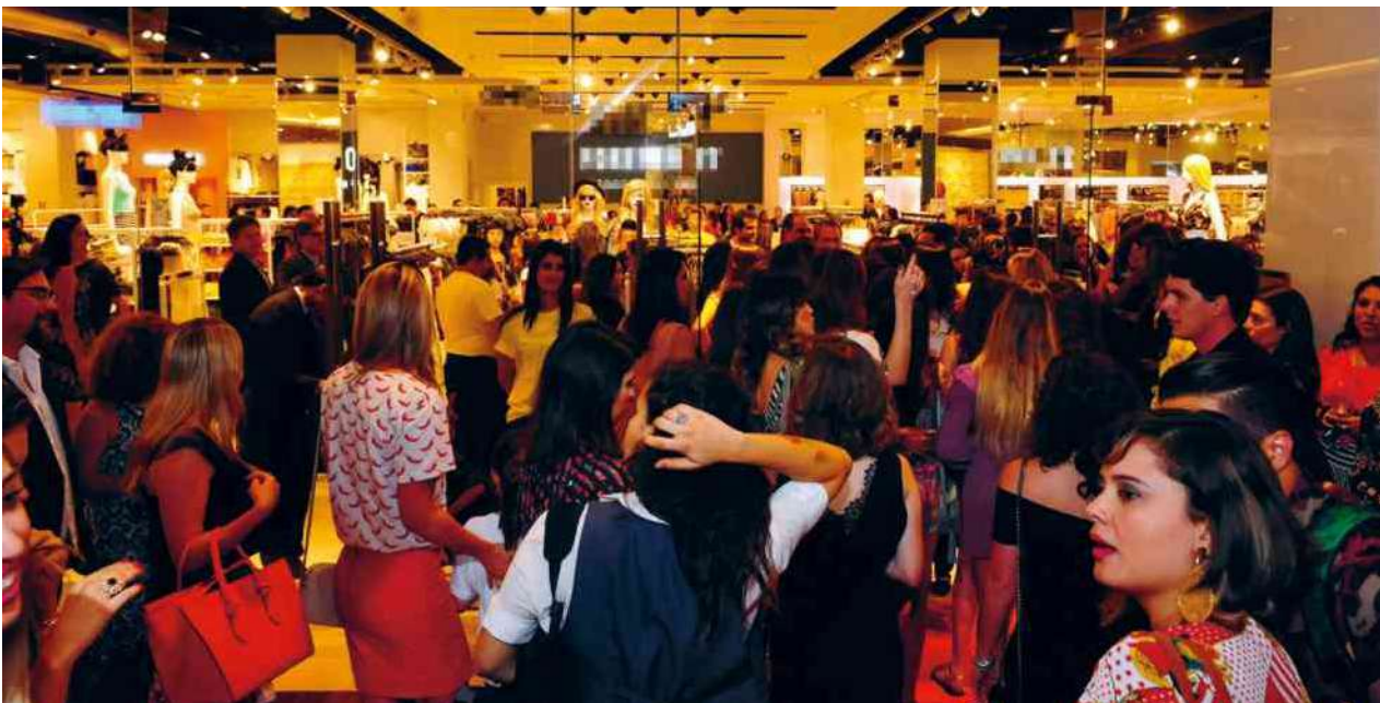
Bruno Peres/CBDA Press. Brasil, Brasília - DF

free shop: loja em áreas de fronteiras ou em aeroportos internacionais que comercializa produtos importados e nacionais, como alimentos, bebidas e outros.