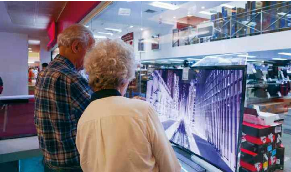
Casal observa televisor de alta definição em shopping center no Rio de Janeiro (RJ). Foto de 2015. Os hábitos culturais são influenciados pelos meios de comunicação de massa.

Os hábitos culturais recebem influência dos meios de comunicação de massa em sua formação e transformação, pois eles alcançam milhões de pessoas com a proposta de informar, entreter e, eventualmente, educar. A televisão, o rádio, o jornal impresso, o cinema, etc. são considerados veículos de ampla difusão porque atingem a massa , ou seja, uma quantidade indeterminada de indivíduos que, de maneira anônima e difusa no espaço-tempo, congrega-se numa mesma atividade e/ou interesse. Quando se refere à produção industrial e/ou ao consumo, o termo faz referência a algo que busca atingir a maioria da população. Esse potencial quantitativo também está nas expressões “massa revolucionária” ou “democracia de massas”.