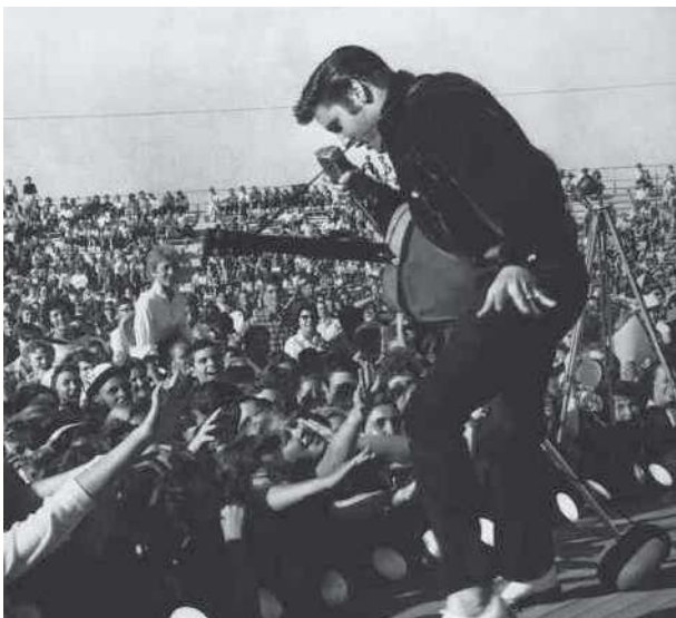
Centenas de fãs assistem a show de Elvis Presley, em 1957.

Determinadas práticas culturais – como o esporte, a moda, os estilos de penteados, as compras, os jogos, os rituais – nivelam a cultura dos setores sociais, sobrepondo hierarquias e extrapolando as fronteiras físicas e sociais, avalia o crítico literário inglês Steven Connor (1955-). Isso significa que as esferas do cultural, do social e do econômico deixam de ser distinguíveis umas das outras. O rock é um exemplo de fenômeno de influência global que unifica gostos, mas se combina com uma pluralidade de estilos, de mídias e de identidades étnicas espalhadas pelo mundo.