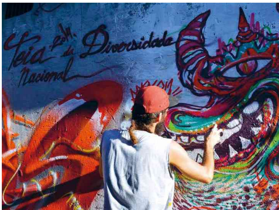
Grafitadores fazem intervenção em beco em Natal (RN), durante o evento Teia Brasil 2014. Eventos como esse valorizam a diversidade e a solidariedade nas manifestações culturais.

Voltamos ao ponto de partida deste capítulo e reconhecemos que, diante das intensas e aceleradas mudanças sociais, políticas e econômicas no último século, as raízes culturais do ser humano estão sendo continuamente revolvidas, o que reforça o caráter dinâmico da vida em sociedade.