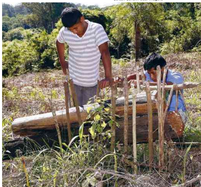
Preparo de mundêu (armadilha de caça) em aldeia Guarani-Mbyá, em Salto do Jacuí (RS). Foto de 2014.

Pequeno livro escrito em árabe encontrado com um africano morto durante a Revolta dos Malês, na Bahia, em 1835.