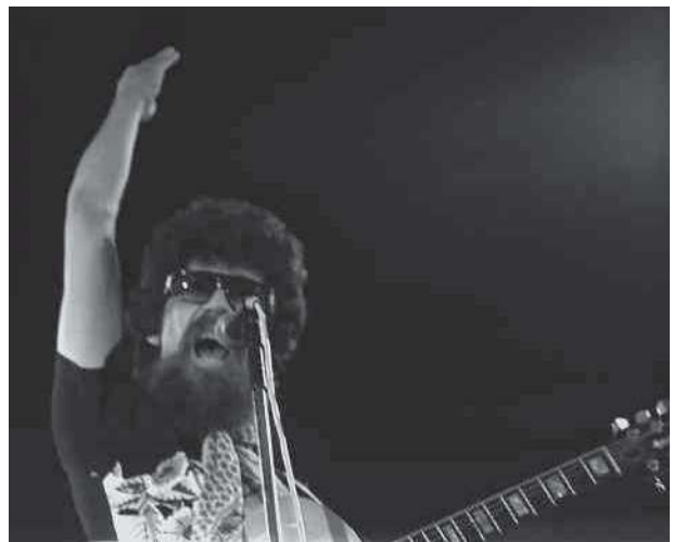
O músico baiano Raul Seixas foi um dos principais artistas do rock brasileiro. Seixas inovou ao misturar ritmos e temas brasileiros ao rock norte-americano. Foto de 1982.