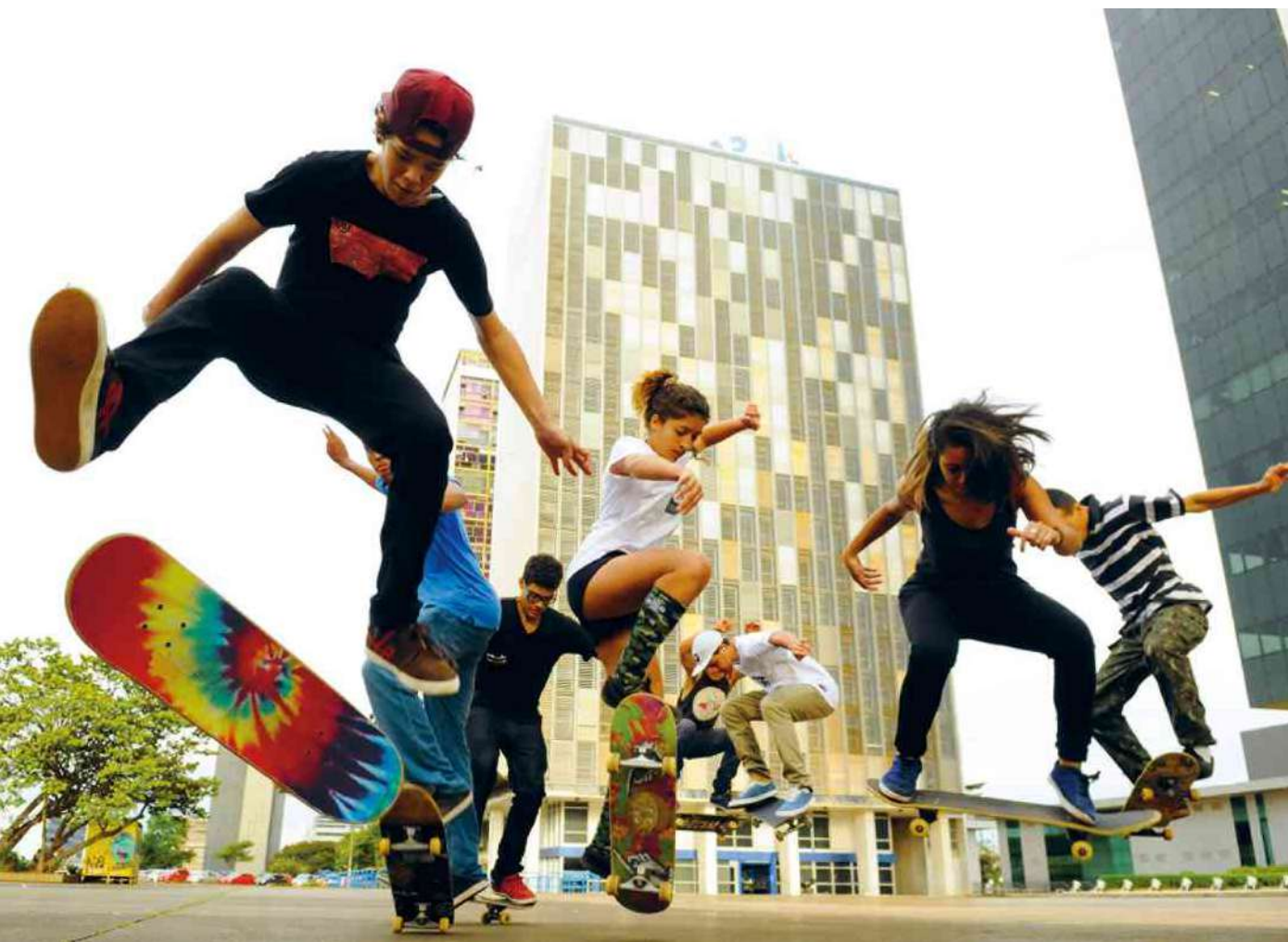
Carlos Vieira/CBD.A. Press. Brasil. Brasília - DF

O processo de transculturização – pelo qual as diferentes culturas transitam entre as nações – tem criado novas configurações com elementos de várias culturas, mantendo aspectos locais, regionais e nacionais. Na aparência, ela provoca, simultaneamente, a "ocidentalização", a "orientalização", a "africanização", a "indigenização". Pulseiras de adorno, os diferentes tipos de corte de cabelo, a linguagem com que nos comunicamos usualmente – todas essas manifestações fazem surgir expressões sociais sincréticas, mistas, que reinterpretem a realidade social a que se referem.