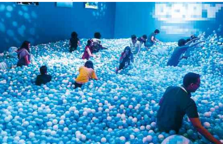
Público se diverte em feira de cultura geek realizada em São Paulo (SP), em 2015. Jogos eletrônicos, seriados televisivos e histórias em quadrinhos são gostos compartilhados pelos geeks .